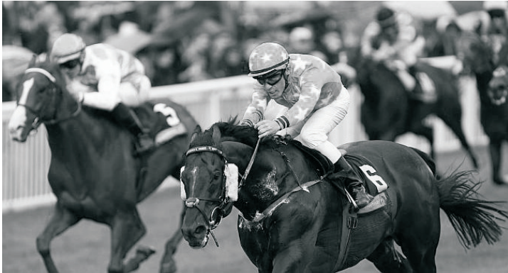
Giant Sandman

A Baden-Baden-i „Nagy hét” a német galoppsport talán legnagyobb ünnepe évről évre. Az augusztus végén megrendezésre kerülő, egy hetes meeting-en a régió legjobbjai mellett Európa számos országából érkeznek a kiváló telivérek. A Gr. I-es Grosser Preis von Baden (2400 m) és a Gr II-es besorolású Darley Oettingen Rennen (1600 m) mellett a Gr. II-es, 1200 méteres Goldene Peitsche a leginkább várt futam. A közelmúltban mi is többször vártuk nagy izgalommal a sprintfutamot, melyet Overdose is megnyert, majd a veretlenségét is itt veszítette el. Ebben az évben némi meglepetésre norvég győzelmet hozott a futam, hiszen a Rune Haugen által trenírozott Giant Sandman biztosan, három hosszal verte a másodfavourite, francia Gammarth-ot és a szélső esélyű, hazai Namera-t, akik mögött csak negyedikként ért célba a legnagyobb kedvenc, Amarillo.