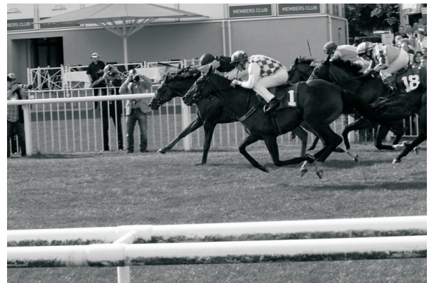
Piotr Krowicki Antaro-val győzött egy népes mezőnyben