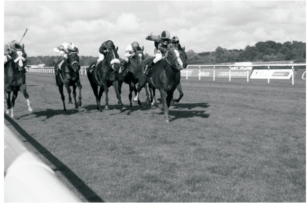
Polish Vulcano (W. Panov) győzelme Gr. III-ban a nyitónapon